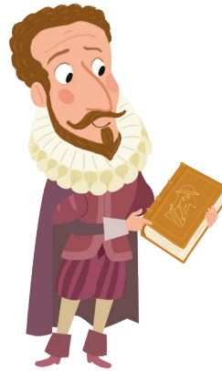
d. Miguel de Cervantes