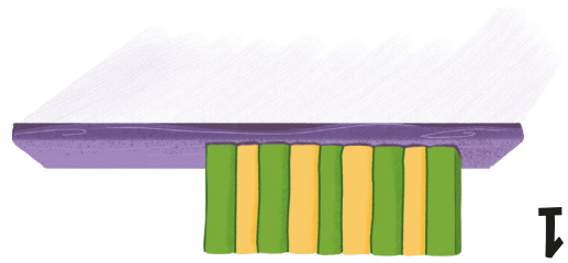
SIGUE LA SECUENCIA