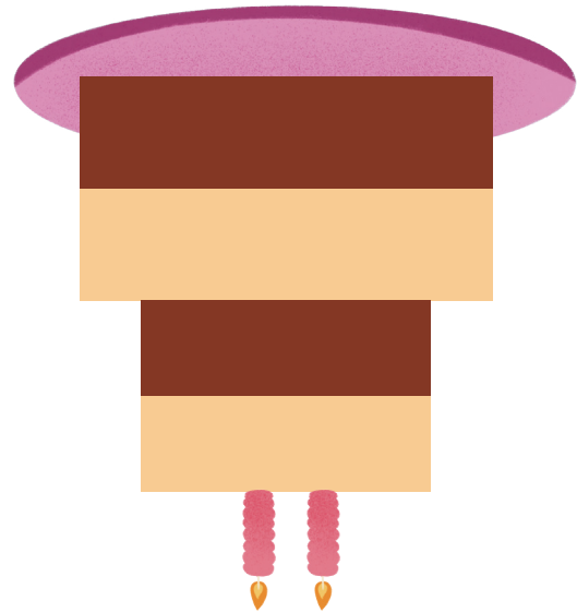
LA TARTA GIGANTE